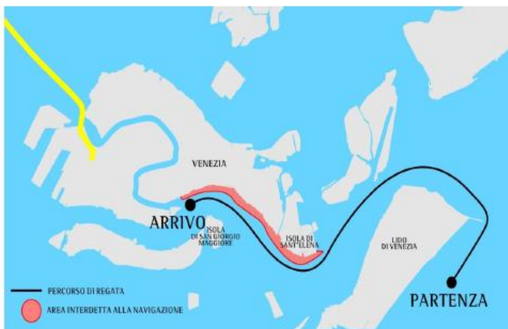
SCHEMA ORIENTATIVO DEL PERCORSO

Per gli altri ospiti, soci, amici, simpatizzanti ecc. la partecipazione è consentita, qualora non sia stato raggiunto il numero massimo di partecipanti al buffet, previa prenotazione e relativo pagamento della quota di € 25 a persona.