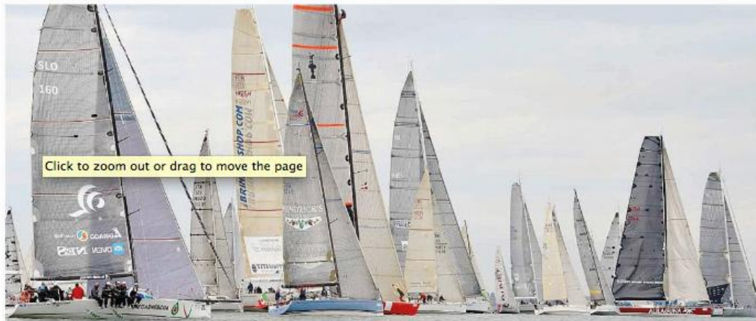
La bellissima selva di vele delle 191 barche che hanno partecipato alla Veleziana, la grande classica d'autunno organizzata dalla Compagnia della vela di Venezia

Ben 191 imbarcazioni hanno partecipato alla regata d'autunno della Cdv con spettacolare traguardo a San Marco