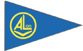
Associazione Velica Lido